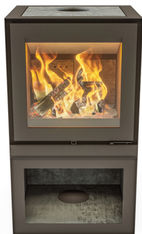
MAX B HOUTVAK