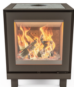
MAX B POOTJES